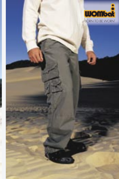
WB903 Mens Diggers Wombat

100% Baumwolle, Canvas 30, 32, 34, 36, 38 175 g/m 2