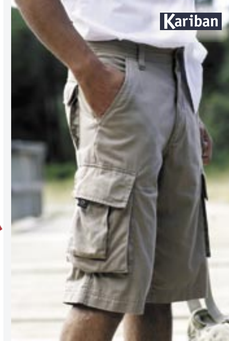
KB777 Kariban Trekker Shorts Kariban