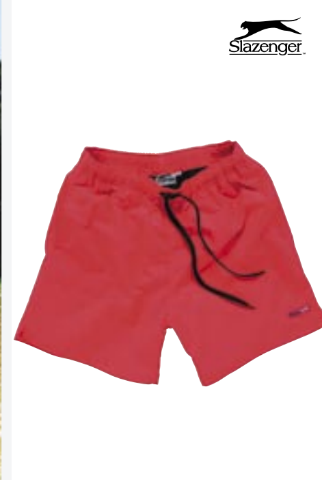
N770 Beach Shorts Slazenger

70% Baumwolle/30% Nylon, angeraut S, M, L, XL, 2XL