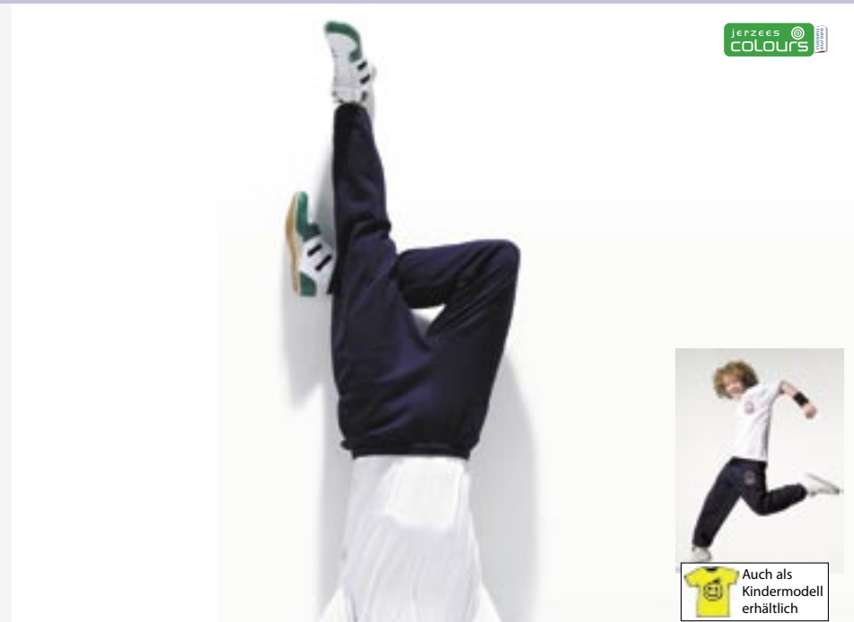
Z750/Z750k Sweathose 750M Jerzees Colours

50% Baumwolle/50% Polyester Z750: S, M, L, XL Kindergrößen (Z750k): 104, 116, 128, 140, 152 260 g/m 2