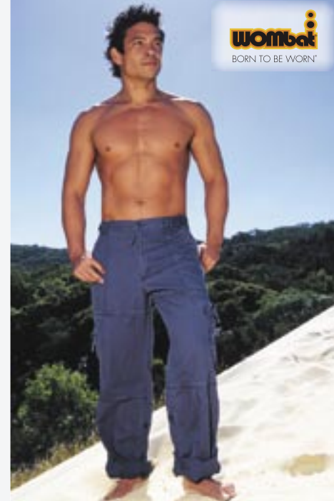
WB901 Mens Rollies Wombat

100% Baumwolle 30, 32, 34, 36, 38 225 g/m 2