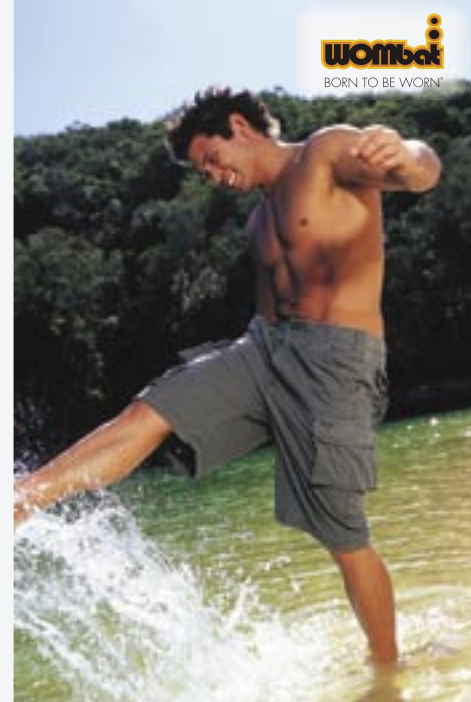
WB904 Mens Taupo Shorts Wombat

100% Baumwoll-Canvas Größen: 30, 32, 34, 36, 38