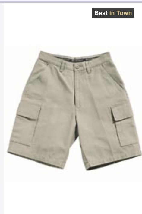
B3501 Cargo Shorts Best in Town