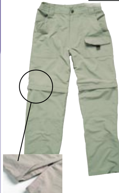
B5418 Quick Dry Pants Best in Town