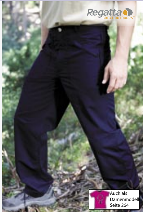
RG170 Action II Hose Regatta

65% Polyester/35% Baumwolle Bundweite: 32, 34, 36, 38, 40, 42 inch Länge: 31, 33 inch 180 g/m 2