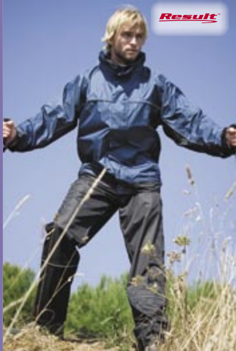
RT97 Trekking/Training Trousers Result

Außen: Ripstop mit PU Beschichtung, Innen: 100% Polyester mit 190T Polyester XS, S, M, L, XL, 2XL, 3XL