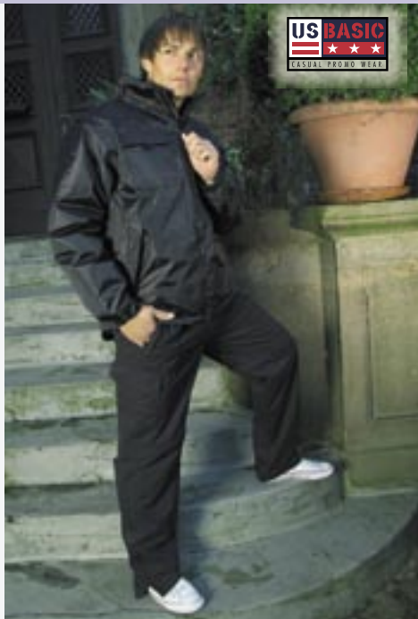
U1563 Norwood Zip-Off Hose US Basic

65% Polyester/35% Baumwolle S, M, L, XL, 2XL