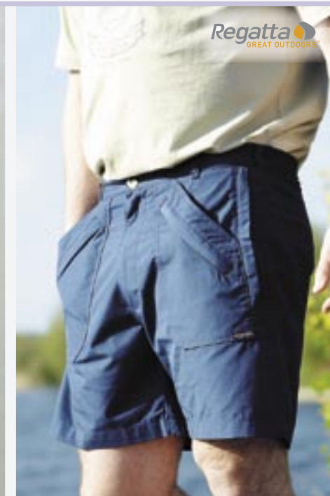
RG174 Action Shorts Regatta

65% Polyester/35% Baumwolle 32, 34, 36, 38, 40, 42 inch