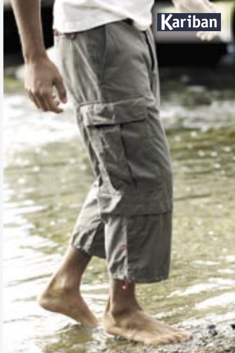
KB775 Kariban Walker Hose Kariban

30%Nylon / 70% Baumwolle 165 g/m 2 Bundweiten/Inch (Konfektionsgrößen): 27 (40), 28 (42), 30 (44), 31/32 (46), 33 (48)