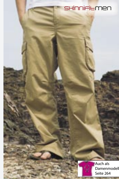
SFM65 Mens Cargo Trousers SkinniFit

100% Baumwolle Größen: 30, 32, 34, 36, 38, 40 175 g/m 2