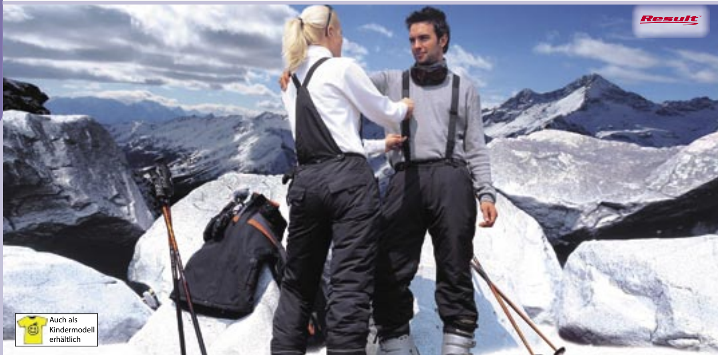
RT106M (Herrenmodell), RT106F (Damenmodell) Mens Ski Trousers / Ladies Ski Trousers Result

320D Taslon S, M, L, XL, 2XL (Herrenmodell), XS, S, M, L, XL, 2XL (Damenmodell) 280 g/m 2