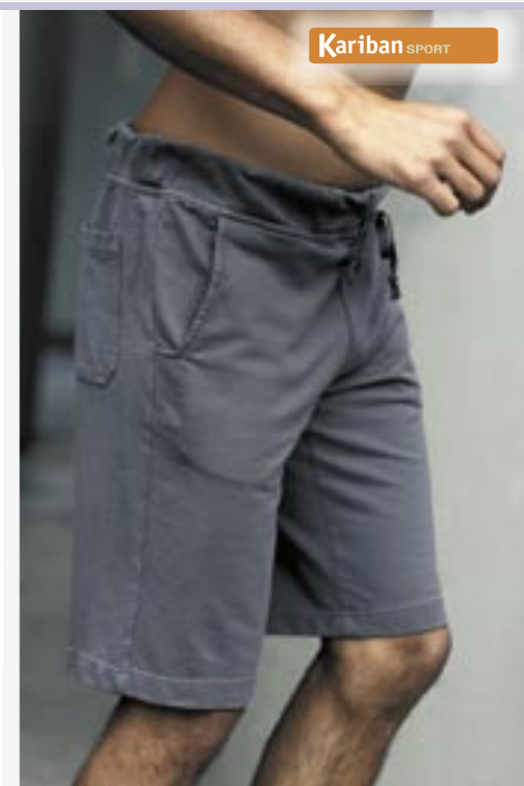
KB113 Kariban Leisure Bermuda Kariban