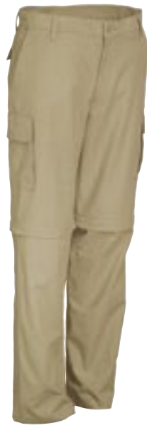
E7475 Trekking Zip-Off Pants Promodoro