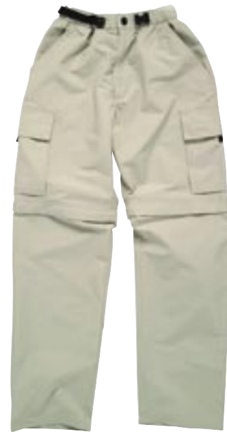
B3509 Zip Off Pants Best in Town

70% Baumwolle/30% Nylon XS, S, M, L, XL, 2XL