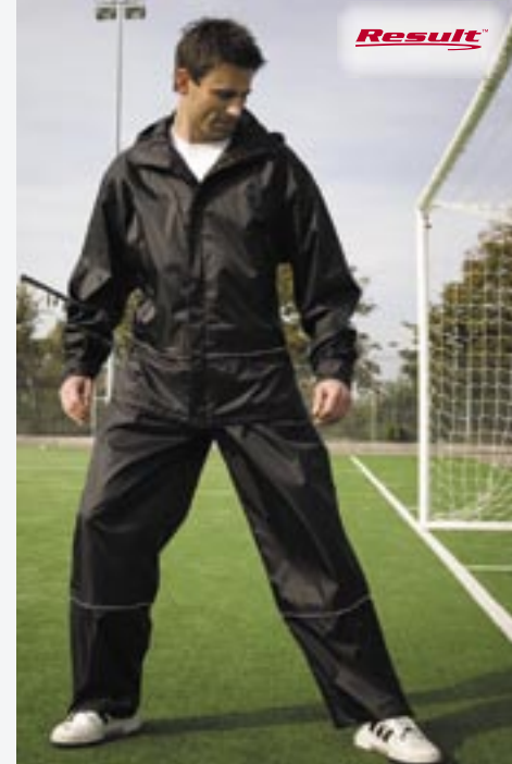
RT156X Stormstopper Pro-Coach Hose Result

100% Polyester/100% Nylon S/M, L/XL, 2XL