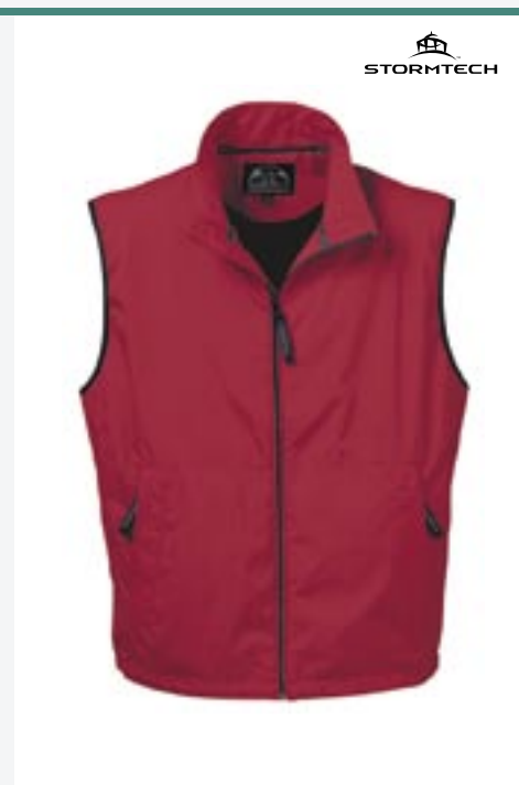
ST44 Fleet Microripstop Bodywarmer Stormtech