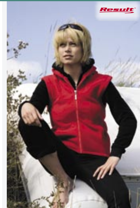
RT84F Cesse Hoody Semi-Micro Gilet Result