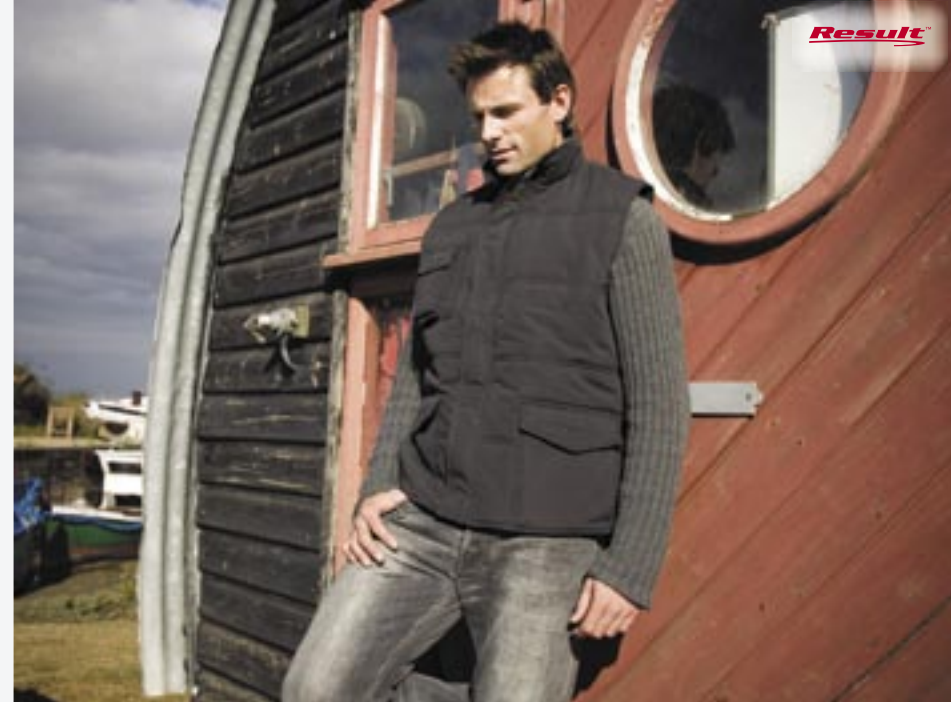
RT94 Promo Bodywarmer Result

100% Polyester/190T Nylon S, M, L, XL, 2XL, 3XL, 4XL