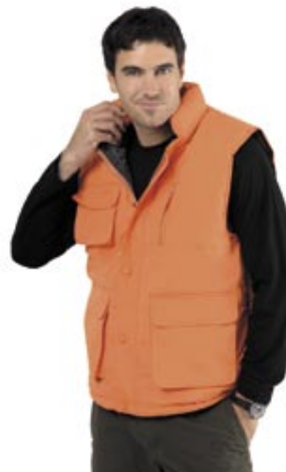
L865 Viper Bodywarmer Sol's