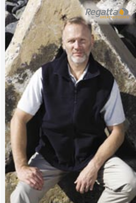
RG700 Haber II Bodywarmer Regatta