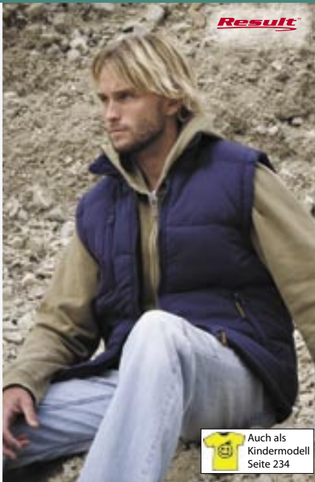
RT88A Hooded Bodywarmer Result