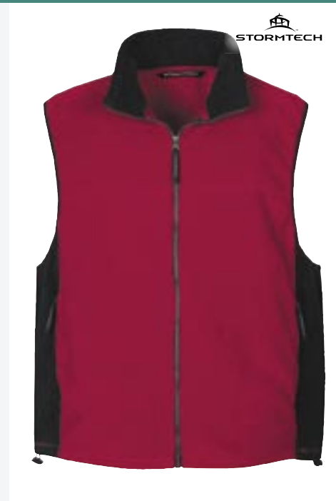
ST41 Chinook Fleece Zip Bodywarmer Stormtech