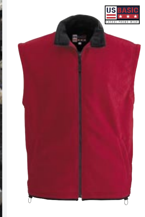
U879 Houston Fleece Bodywarmer US Basic