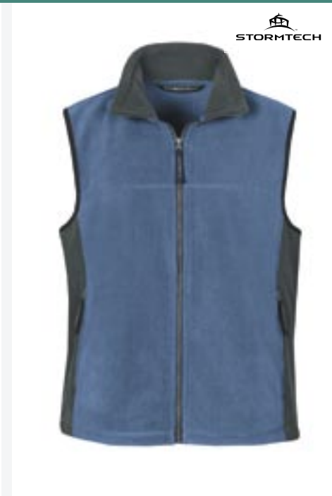
ST41F Womens Chinook Fleece Zip Bodywarmer Stormtech