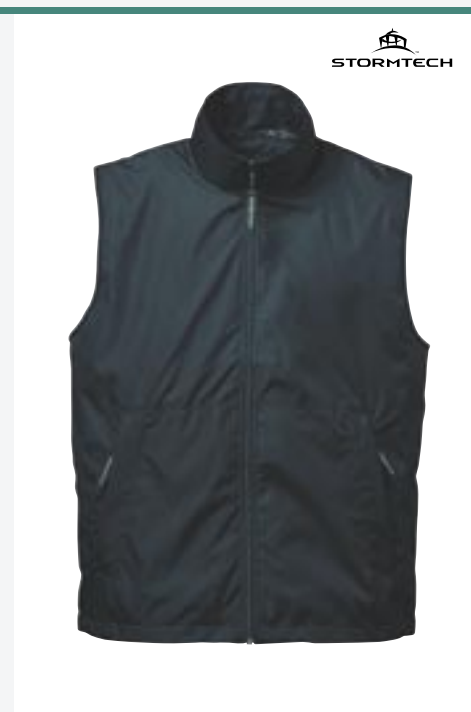
ST44F Womens Fleet Microripstop Bodywarmer Stormtech