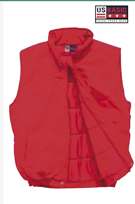
U710 Calgary Bodywarmer US Basic

65% Polyester/35% Baumwolle M, L, XL, 2XL