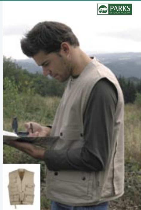
PK05a Gabon Outdoorweste uni Parks