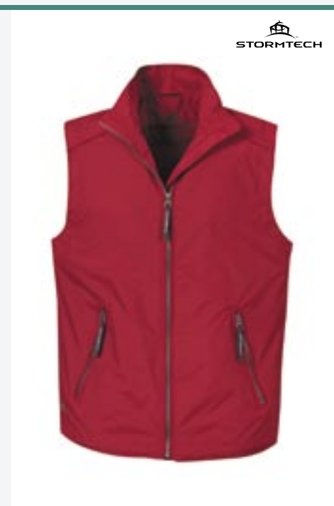
ST42F Womens Horizon Bodywarmer Stormtech