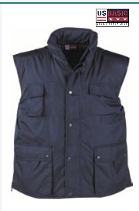
U1421 Workwear Bodywarmer US Basic