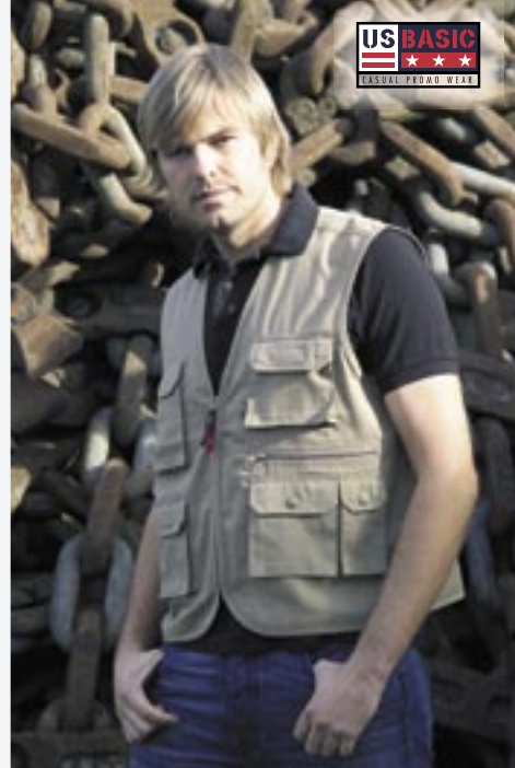
U1425 Outdoor Weste US Basic