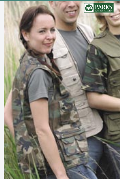
PK05b Gabon Outdoorweste Camouflage Parks