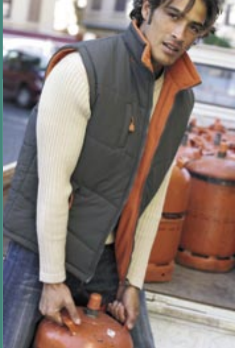
KB681 Kariban Bodywarmer Alaska Kariban

100% Taslan-Nylon / 100% Polyesterfütterung S, M, L, XL, 2XL 560 g/m 2