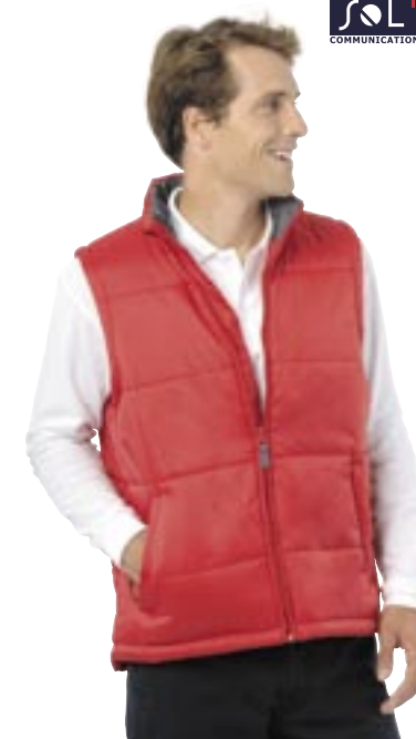
L868 Bodywarmer Warm Sol's