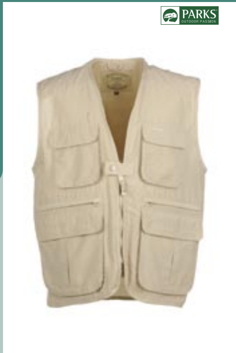
PK03 Tropical Outdoorweste Parks