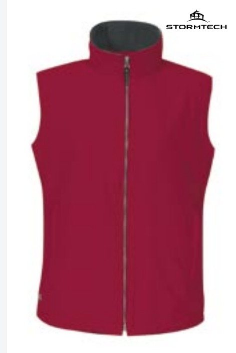
ST31F Womens Microfleece Lined Vest Stormtech

Obermaterial: 100% Nylon, Futter: 100% Polyester S, M, L, XL