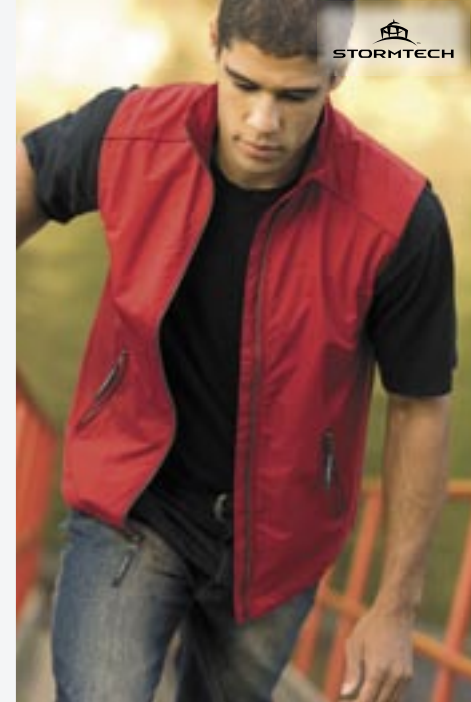
ST42 Horizon Bodywarmer Stormtech