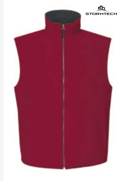
ST31 Microfleece Lined Vest Stormtech

Obermaterial: 100% Nylon, Futter: 100% Polyester S, M, L, XL, 2XL