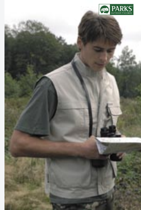
PK04 Rio Outdoorweste Parks