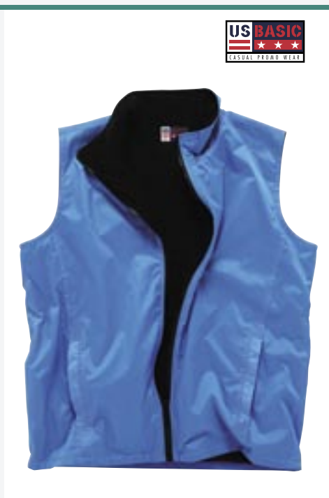
U1422 Basic Bodywarmer US Basic

Außen: 100% Nylon Futter: 100% Polyester S, M, L, XL, 2XL