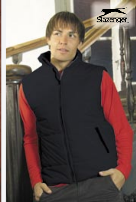
N3420 Quilted Bodywarmer Slazenger

100% Polyester S, M, L, XL, 2XL 450 g/m 2