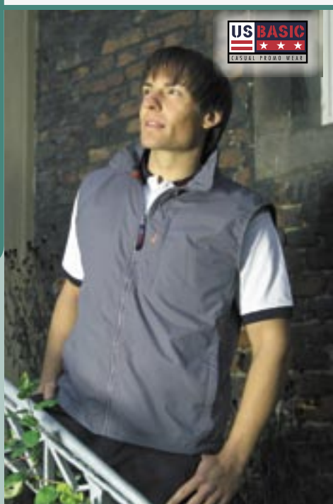
U1427 Utica Bodywarmer US Basic