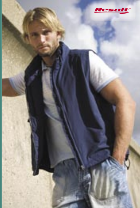
RT60 Crew-Wear Gilet / Weste Result

100% Nylon/100% Polyester XS, S, M, L, XL, 2XL