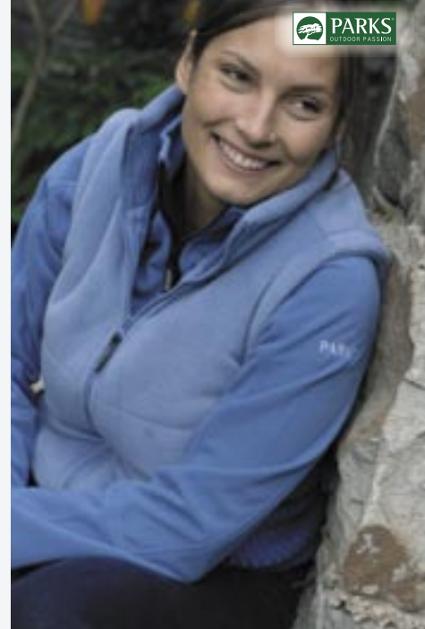
PK03023 Ladies Bodywarmer Moon Parks

Außen: 100% Poly. Fleece, Fütterung: 100% Poly., Innen: 100% Poly. Tricot XS, S, M, L, XL, 2XL 280 g/m 2