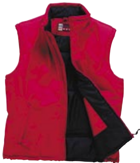
U1424 Orlando Bodywarmer US Basic