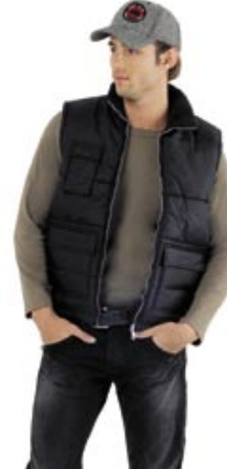
L861 Worker Bodywarmer Sol's