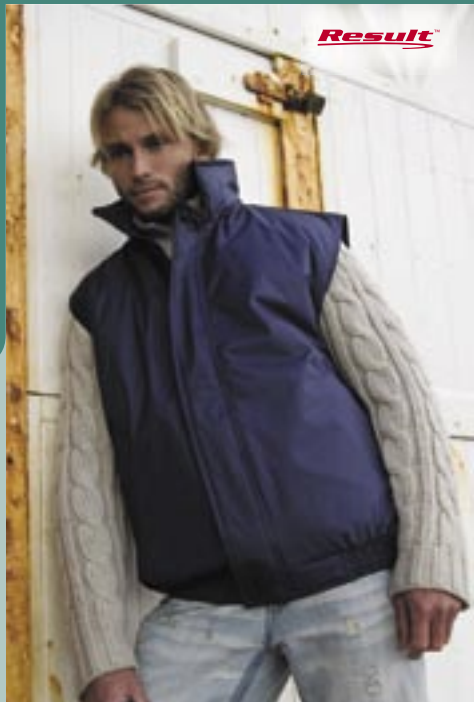
RT113 Wattierter Bodywarmer Result

100% Polyester/100% Nylon S, M, L, XL, 2XL