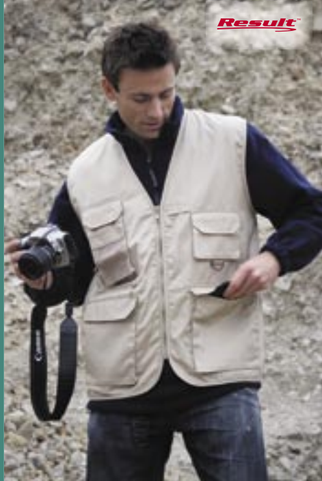
RT45 Adventure Safari Weste Result