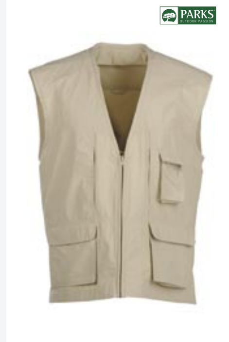
PK01 Palmer Outdoorweste Parks