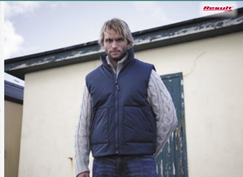
RT44 Fleece Lined Bodywarmer Result

100% Nylon/100% Polyester S, M, L, XL, 2XL