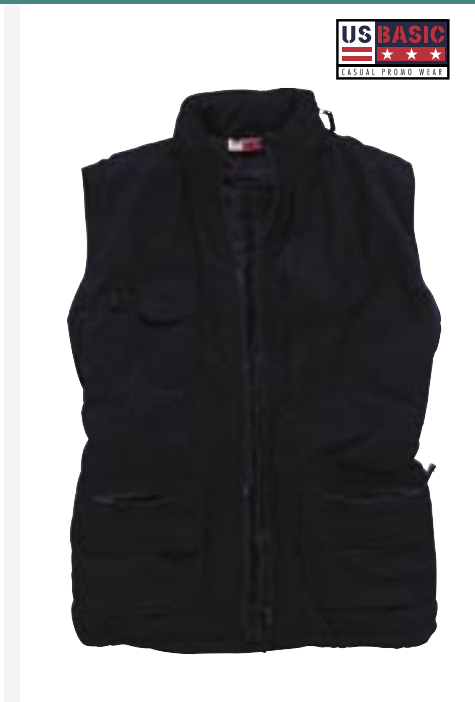
U717 Bodywarmer Free US Basic

65% Polyester/35% Baumwolle Futter: 100% Polyester, wattiert S, M, L, XL, 2XL, 3XL