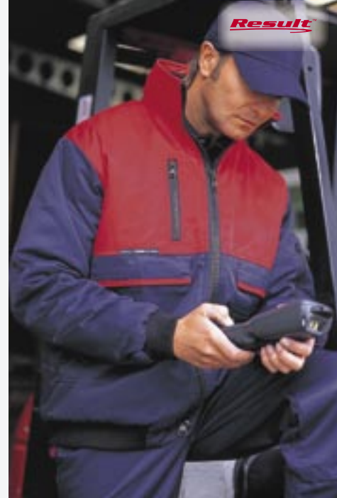
RT74 Workguard Pilot Jacket Result

100% Polyester/100% Nylon S, M, L, XL, 2XL