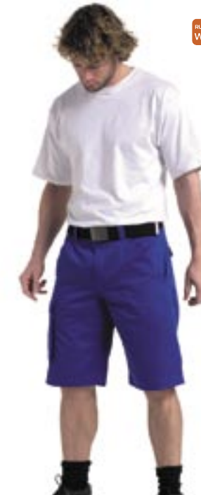
Z002 Essentials Workwear-Shorts 002M Russell Workwear

65% Polyester / 35% Baumwolle Russell Workwear 28, 30, 32, 34, 36, 38, 40, 42, 44, 46 und 48 inch 245 g/m 2