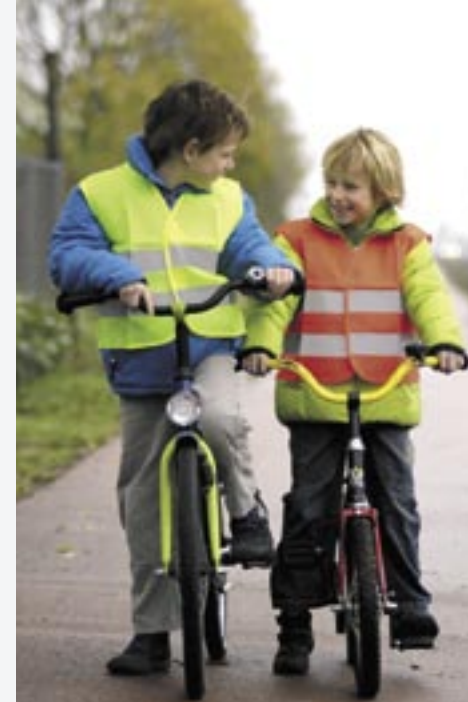
X218 Sicherheitsweste für Kinder

Nylon XS, S Sicherheitsweste für Kinder mit zwei umlaufenden Reflektionsstreifen.