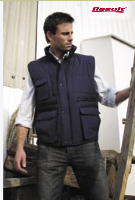
RT127 Lance Workguard™ Bodywarmer Result

Außen: 100% Poly. Pongee mit PVC, Innen: 180 g/m 2 Poly. Futter: 190T Taffeta Nylon S, M, L, XL, 2XL, 3XL