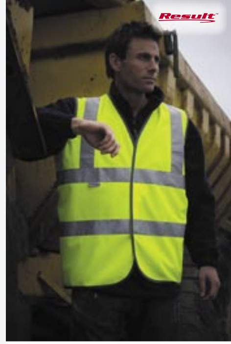
RT21A High Viz Sicherheitsweste

100% Polyester S/M, L/XL, 2XL, 3XL Warnweste mit EN471 Klasse 2 Prüfung gem. EG Richtlinie 89/686. Reflektorstreifen von Scotchlite™ auf Vorder- und Rückseite sowie Schultern. Klettverschluss vorn. Grauer Polyesterrand. Großzügiger Schnitt zum Tragen über eigentlicher Bekleidung.