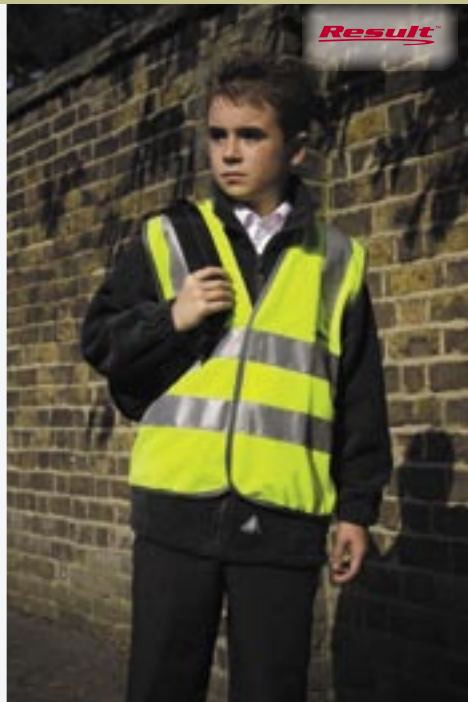
RT21j Junior High-Vis Vest

100% Polyester S (4-6), M (7-9), L (10-12) EN1150 zugelassen. 89/686/EEC. Großzügig geschnitten, um über Pullover, Jacke... getragen zu werden. Klettverschluss an Frontseite. Graue Polyesterreifassung. 50 mm breite Reflektionsstreifen. 3M-Scotchlite Materialien.