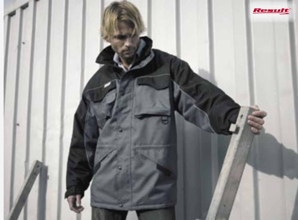
RT72 Heavy Duty Combo Coat Result

600D Oxford Taslon/100% Polyester, 190T Nylon Taffeta Fütterung S, M, L, XL, 2XL, 3XL