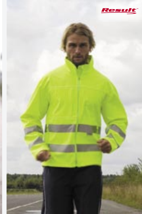
RT117 Neon High-Vis Softshell

93% Polyester / 7% Elasthan S, M, L, XL, 2XL, 3XL 345 g/m² EN471-zertifizierte Softshelljacke. 3-lagiges Softshell-Material. Innenmembran aus TPU. Innenfutter aus Microfleece sowie 100% Polyester Taffeta. Wasserdicht bis 8.000mm. Windabweisend. Dehnbares Material. Verlängertes Rückenteil. 2 Fronttaschen. 1 Brusttasche. 2 Innentaschen. Handytasche innen. Zugband im Bund. 50mm 3M™-Scotchlite Reflektionsstreifen. Verdeckter Veredelungszugang.