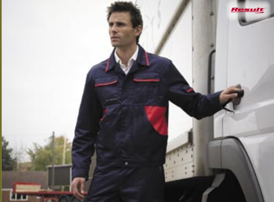
RT75 Workguard Drivers Jacke Result

50% Baumwolle, 50% Polyamid (Danish Beaver Nylon 240 g/m 2 ) S, M, L, XL, 2XL