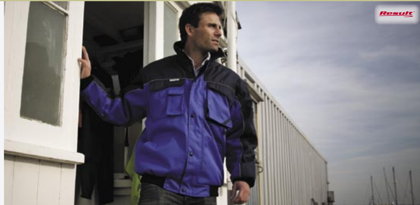
RT71 Heavy Duty Pilot Jacket Result

Obermaterial: 190T Polyester, PVC-beschichtet, Innenmaterial: ¼ Polyester/Baumwollgemisch im Karodesign + 190T Polyester, Futter: 140 g/m 2 Polyester Wattierung S, M, L, XL, 2XL, 3XL