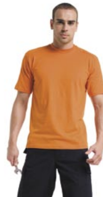
Z10 Workwear-T-Shirt 010M Russell Workwear

100% Baumwolle XS, S, M, L, XL, 2XL, 3XL, 4XL Weiß 175 g/m 2 , Farbig 180 g/m 2