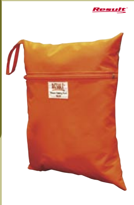
RT213 Tasche für Sicherheitsweste

100% Polyester One-size, 26 x 33 cm Reißverschluss. Passend für 4 x Artikel RT211. Orange