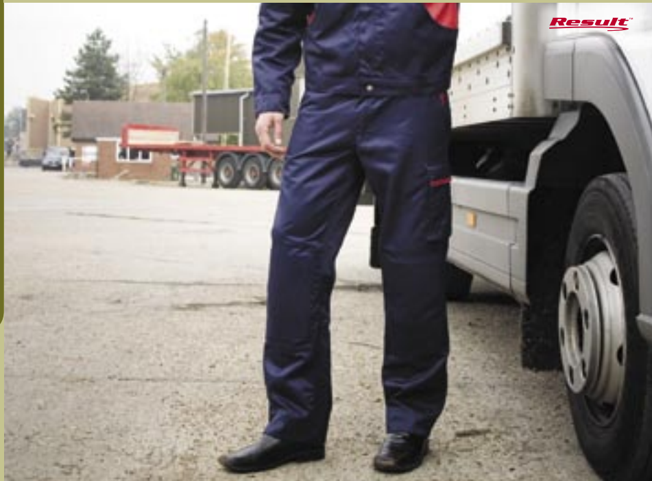
RT76 Workguard Drivers Hose Result

50% Baumwolle, 50% Polyamid (Danish Beaver Nylon 240 g/m 2 ) XS, S, M, L, XL, 2XL, 3XL