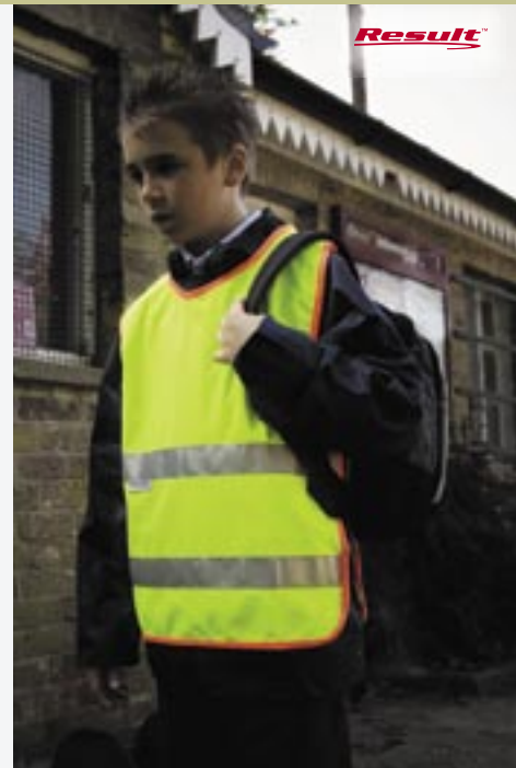
RT212j Kinder Sicherheitsweste

100% Polyester S/M (3-5 Jahre), L/XL (6-10 Jahre) Strick-Polyester Seitenbefestigungen. 30mm 3M-Reflektionsstreifen. EN1150, weit geschnitten. Kann über eigentlicher Kleidung getragen werden.