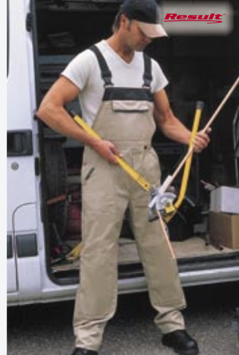
RT77 Workguard Latzhose Result

50% Baumwolle, 50% Polyamid S, M, L, XL, 2XL