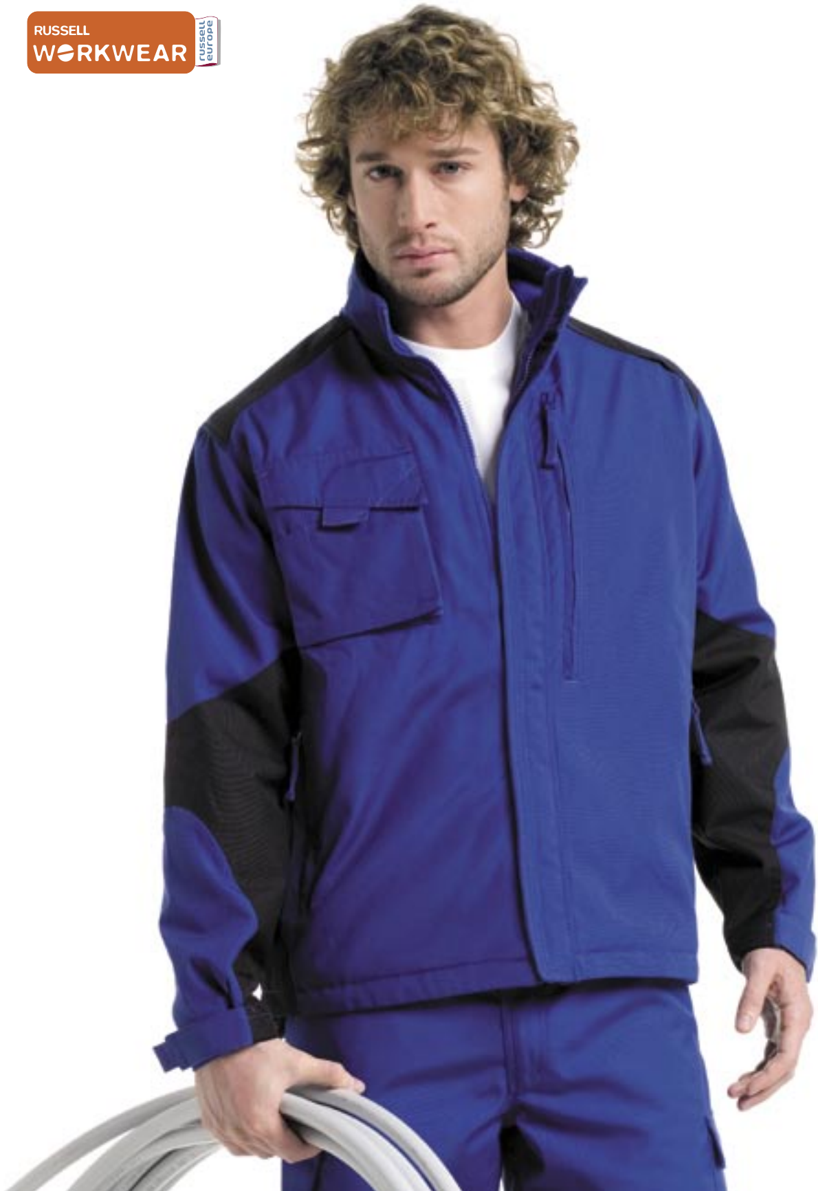
Z17 Workwear Jacke 017M Russell Workwear

Außenmaterial: 65% Polyester/35% Baumwollcanvas. Innenmaterial Körper: 100% Polyester-Fleece, Ärmel: Wattierung und Innenfutter aus 100% Polyester* XS, S, M, L, XL, 2XL, 3XL, 4XL Außen: 260 g/m 2 Innenfutter: 180 g/m 2