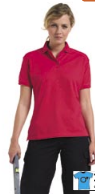
Z11F Damen Workwear-Poloshirt 011F Russell Workwear

100% ringgesponnenes, kardiertes Baumwoll-Piqué Russell Workwear XS, S, M, L, XL, 2XL 215 g/m 2