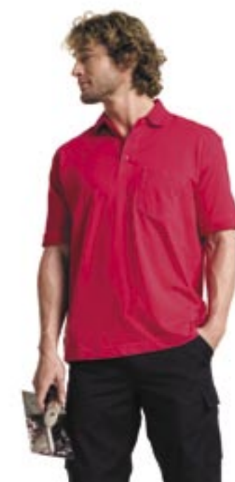
Z11 Workwear-Poloshirt 011M Russell Workwear

100% ringgesponnenes, kardiertes Baumwollpiqué 215 g/m 2 XS, S, M, L, XL, 2XL, 3XL, 4XL