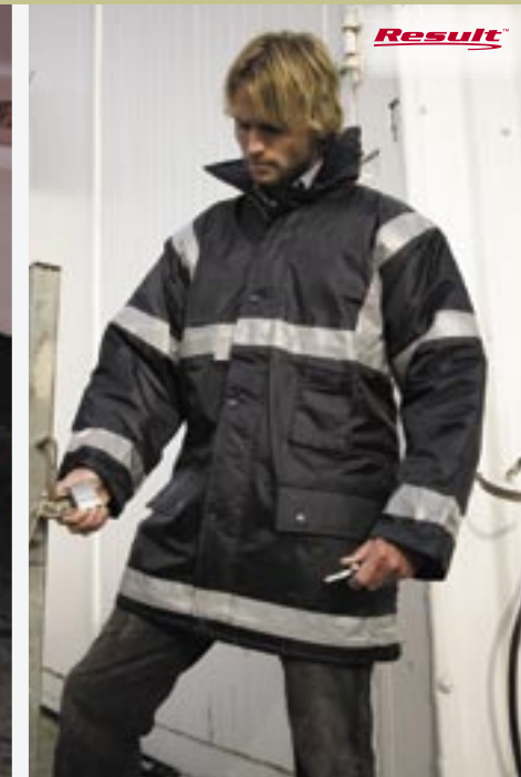
RT23 Management Sicherheitsjacke

Obermaterial: 190T Polyester, PVC-beschichtet, wasserdicht bis 160 mbar, Futter: 190T Polyester, gesteppt Füllung: 140 g/m² Polyester Wattierung S, M, L, XL, 2XL, 3XL Kapuze. 3M-Reflektionsstreifen. Winddichte Ärmelbündchen auf Innenseite. Abgedichtete Nähte. Durchgehender Reißverschluss. Windpatte vorn mit Druckknöpfen. Große Taschen vorn. Handytasche mit Klettverschluss. Transpirationsbeständigkeit: >4. Waschbeständigkeit: >4. Materialwiderstand gegen Eindringen von Wasser (PA): 13.000.