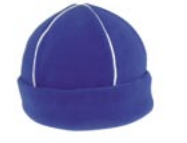
C734 Micro-Fleece Mütze mit Paspel Beechfield