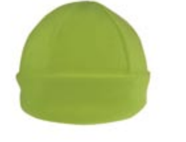
C736 Micro-Fleece Mütze Beechfield