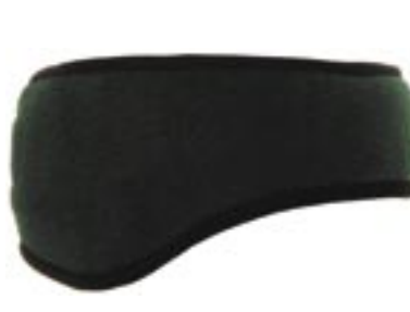
C745 Fleece Ohrenwärmer Beechfield