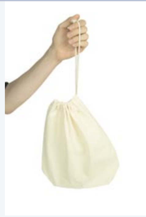
XT010 Zuziehbeutel mit Mittelsteg / Schuhbeutel

100% Baumwolle 20 x 32 x 10 cm 100% Baumwolle. Innenseparation durch Mittelsteg mit 10 cm Breite.