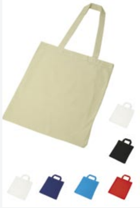
XT005/XT005F Baumwolltasche 22 x 26 cm Apothekertasche)

100% Baumwolle 22 x 26 cm 80 g/m 2 Handliches Format. 5 klassische Farben.