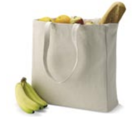
QD23 Canvas Classic Shopper Quadra

100% Baumwolle 43 x 38 x 13 cm 14oz Cotton Canvas. Lange Tragegriffe. Volumen: 19 Liter.