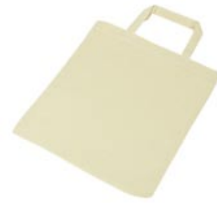
XT006 Baumwolltasche medium 28x32 cm

100% Baumwolle 28 x 32 cm Format zwischen klassischer Größe (38 x 42 cm) und kleiner Apothekertasche.