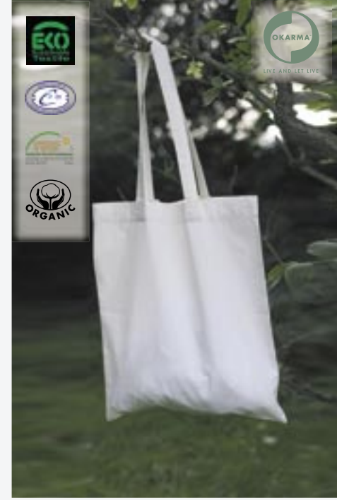
OK70 100% Organic Shopper Okarma

100% organische Baumwolle/Canvas 38 x 42 cm 3.5 Oz Canvas 3.5 Oz-Canvas. Volumen 10 Liter. Baumwolle aus kontrolliert biologischem Anbau.