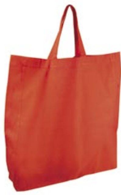
XT90 Baumwolltasche mit Seitenfalte

100% Baumwolle 38 x 42 x 10 cm 140 g/m 2 Klassische Baumwolltasche mit Boden- und Seitenfalte. Grifflänge 35 cm.