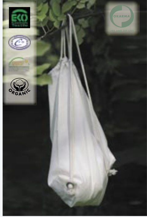
OK71 100% Organic Gymsac Okarma

100% organische Baumwolle/Canvas 45 x 34 cm 3.5 Oz Canvas 3.5 Oz-Canvas. Volumen 12 Liter. Baumwolle aus kontrolliert biologischem Anbau.